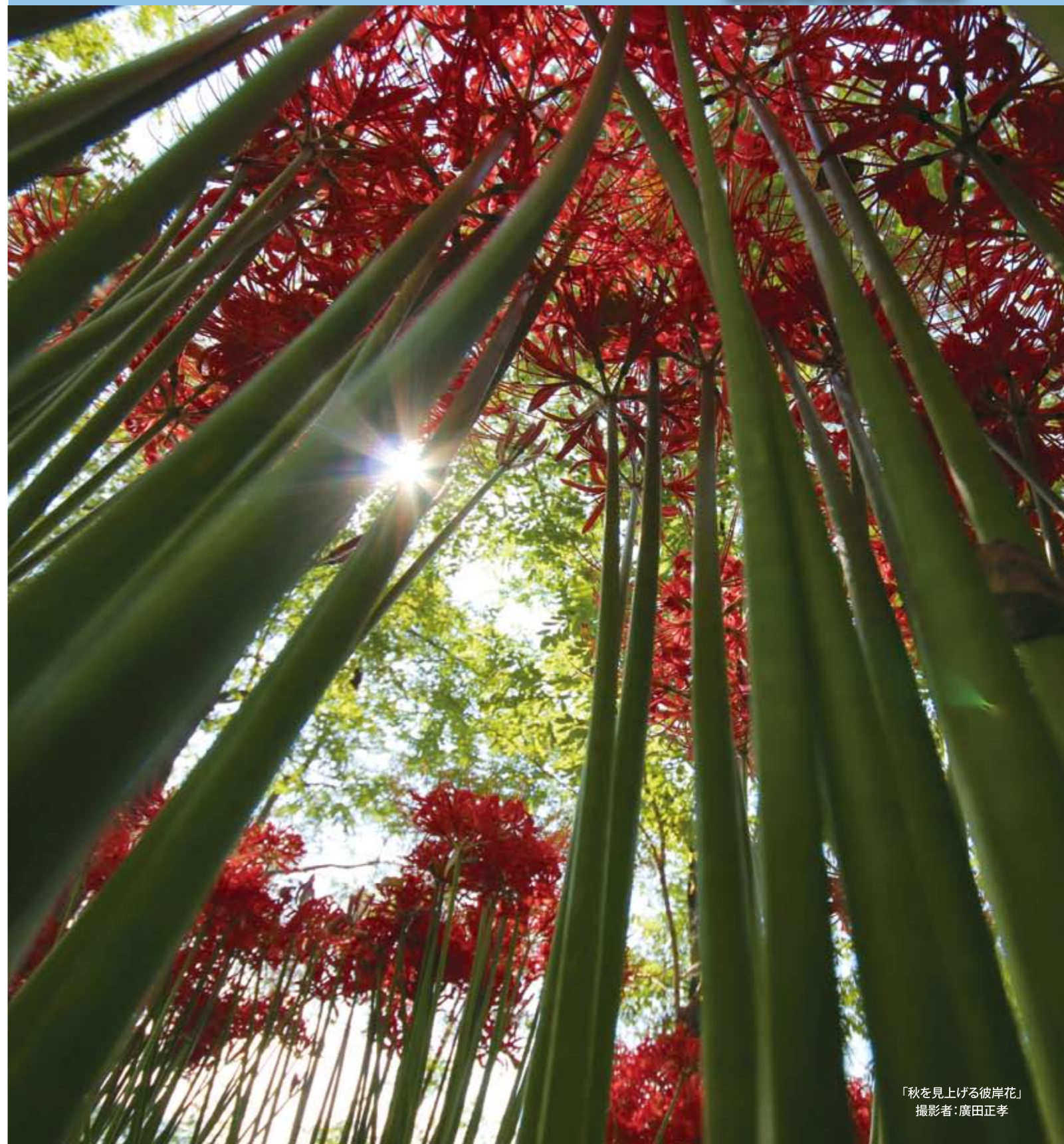
「秋を見上げる彼岸花」