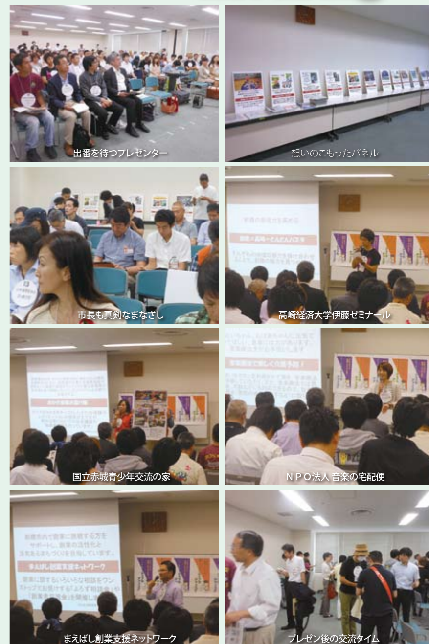
出番を待つプレゼンター