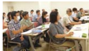
真剣にメモを取る参加者の皆さん