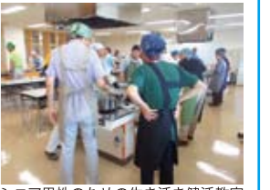
シニア男性のための生き生き健康教室 (H26年度実施事業)