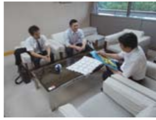
市長との対話が実現

他にも、「ちいむ ふろんとぶりっぢ」が30団体を自分のホームページを使って紹介してくださったり、様々な試みが生まれています。今後がますます楽しみです。