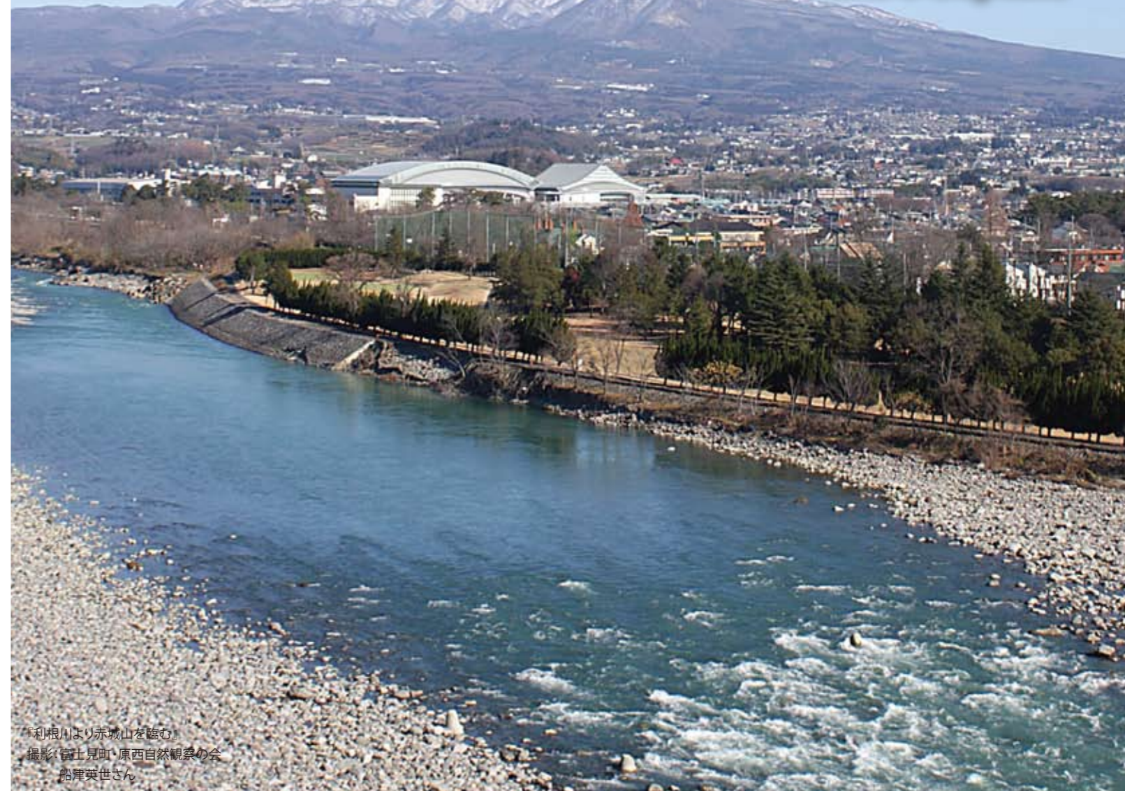
「利根川より赤城山を望む」