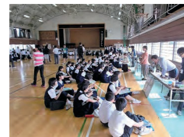
昨年度採択事業として実施した職業教室の様子