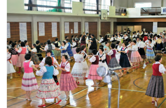
創立48周年記念フォークダンス大会の様子