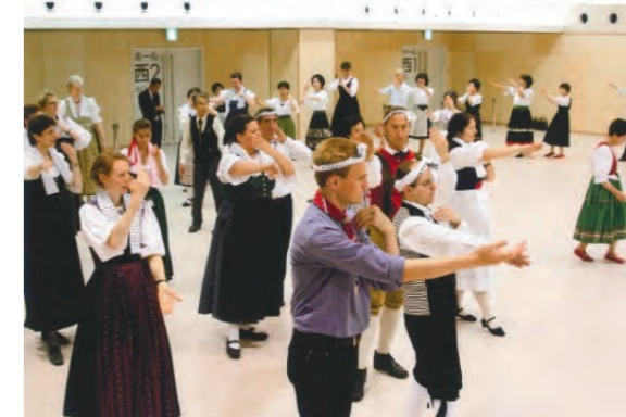
ドイツからのゲストと八木節を踊りました