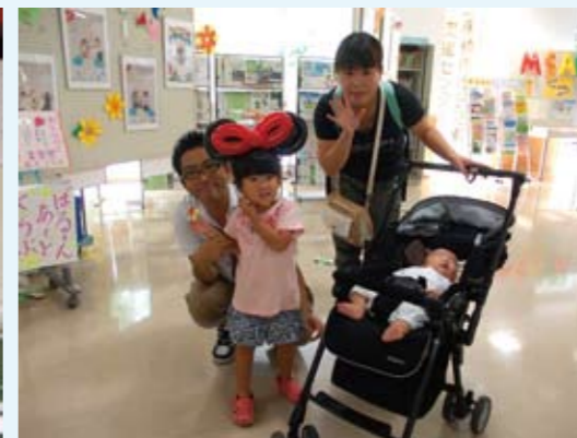
家族で夏休みの思い出に♪