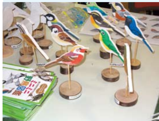
身近な野鳥の説明、クラフト作り