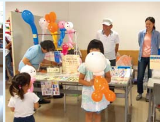
バルーンで寄付活動♪