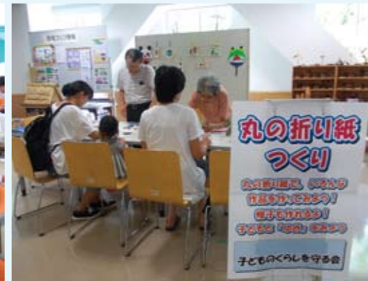
まる折り紙で子どもと一緒に夢をみよう