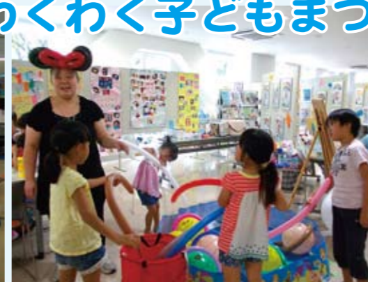
ばーんあーとで魚釣り