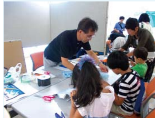
親子で作る天文工作