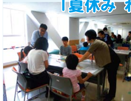
親子で楽しむおこづかいゲーム