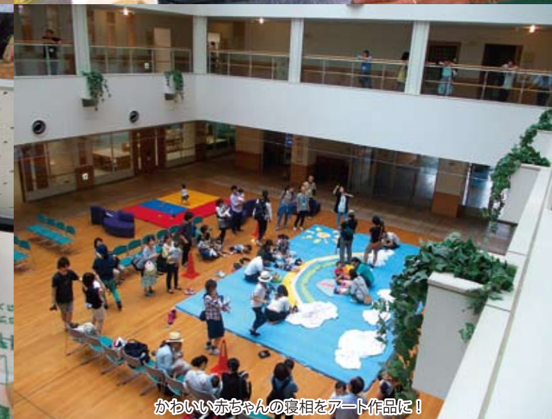
かわいい赤ちゃんの寝相をアート作品に!