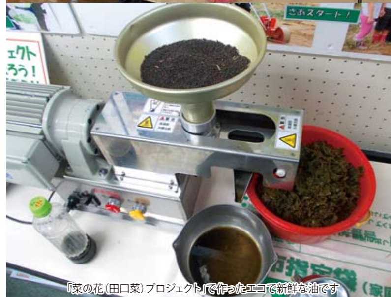
「菜の花(田口菜)プロジェクト」で作ったエコで新鮮な油です