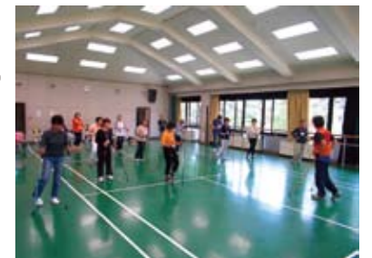
健康寿命を延ばすノルディックウォークの普及(H27年度実施事業)

8月17日(月) 14:00、19:00 (各回約1時間) 場所=Mサポ会議室 申込み=事前申込不要