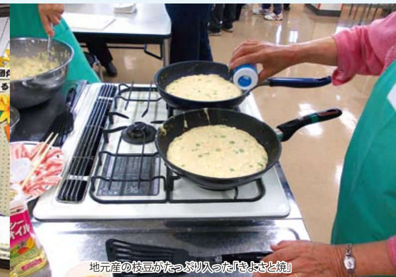
地元産の枝豆がたっぷり入った「きよさと焼」