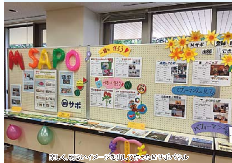
楽しく、明るいイメージを出して作ったMサポパネル